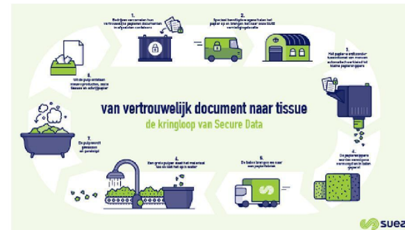
Weergave verwerking vertrouwelijke documenten stroom